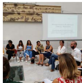
Progetto grafico: Bruno Buffa